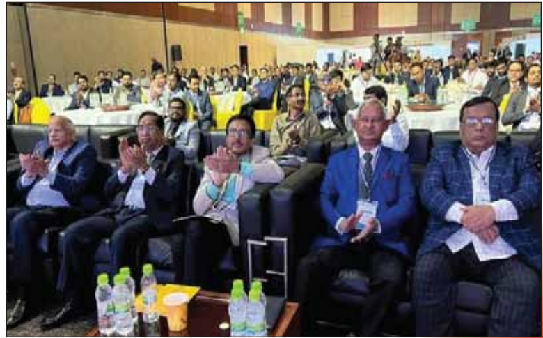
Audience at the Shipping & Logistics International Conference on 23 November, 2022 at HICC, Novotel, Hyderabad organized by The Federation of Telangana Chamber of Commerce and Industry (FTCCI).