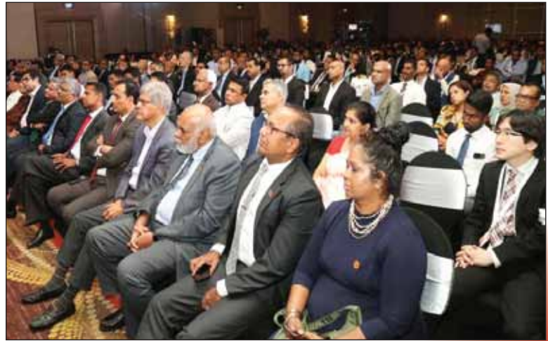
Audience at the Colombo International Maritime & Logistics Conference held in Cinnamon Grand Hotel, Colombo on 01 to 02 November, 2022 organized by CIMC Events.